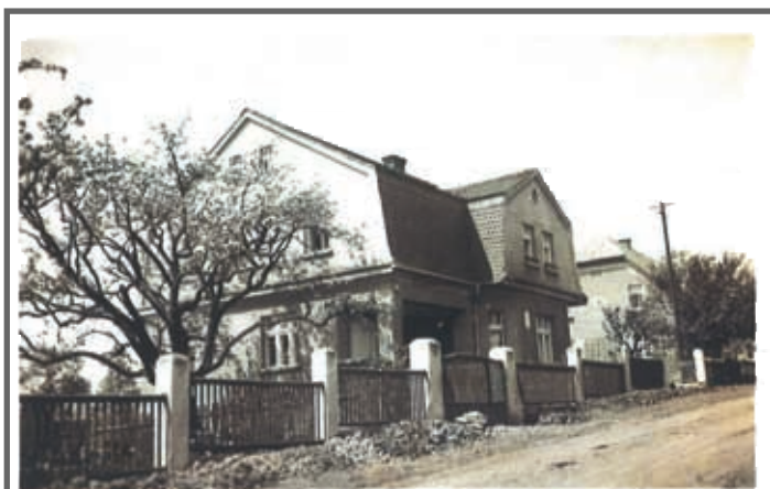
Nové umístění mateřské školy v domě č.p. 47 v Dobkovicích.

Téma úrovně a rozvoje mateřských škol bylo v květnu téhož roku součástí programu konference učitelstva v Praze. Znovu tam byla otevřena otázka naprosto nedostatečných hygienických podmínek stávajících mateřských škol. Konference projednávala mimo jiné i