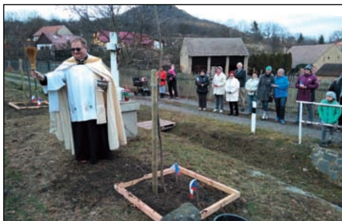
Stromy posvětil třebenický farář