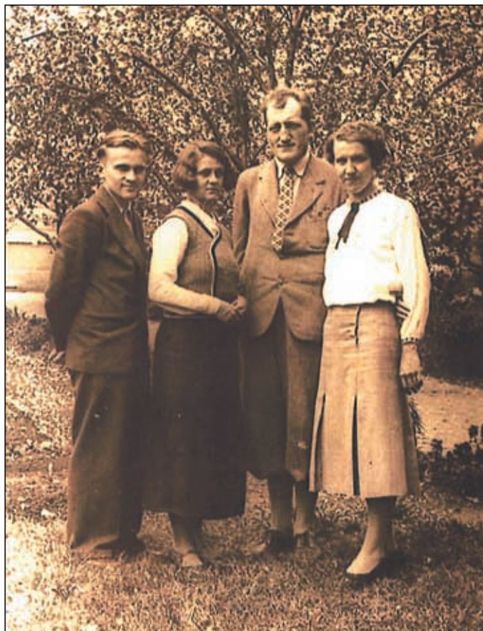
Učitelky s obcí v Chotiměři a Dobkovicích.

Příloha č. 10, budova mateřské školy v Dobkovicích v roce 1932, čp. 47.