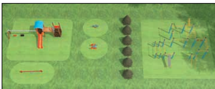
Vizualizace dětského hřiště za fotbalovým hřištěm.