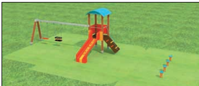
Vizualizace dětského hřiště u bytů za OÚ.

před předáním bytu novému nájemníkovi. Ve většině případů je důvodem třeba jen částečné rekonstrukce stáří bytu, četnost užívání některých částí, nebo kvalita zvolených materiálů při budování bytů. V případě těch nejstarších bytů, mluvíme zhruba o dvou desítkách let užívání. Převážně provádíme opravy odpadních potrubí na to navazujících rekonstrukcí koupelen, opravy elektroinstalace, výměny podlahových krytin a kuchyňských linek apod.. V současné