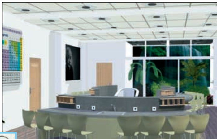
Obrázek 1 návrh učebny - vizualizace

Cílem projektu je podpora infrastruktury pro základní vzdělávání v Základní škole ve Velemíně. V rámci projektu budou jednak realizovány stavební úpravy zaměřené na rekonstrukci stávající odborné učebny přírodních věd, kabinetu přírodních věd a skladu, přípravy chemikálií a chemických pomůcek. Součástí stavebních úprav je rovněž zajištění bezbariérovosti budovy školy. Část projektu je zaměřena na venkovní prostory, kde bude vystaven výukový altán, jenž bude obklopen vodní plochou a arboretum zaměřeným na dřeviny Českého středohoří.