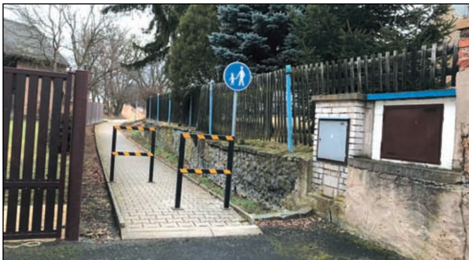
Cesta ke hřbitovu Velemín.