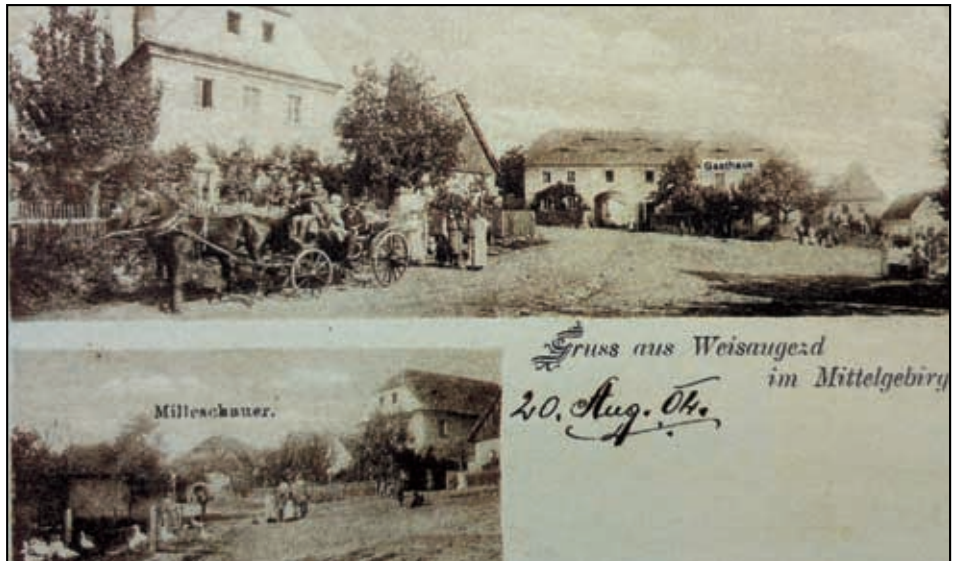
Náves Bílého Újezda,

Výčepní pálenky neboli kořalky byly vlastně imitací pálenek ušlechtilých. Vyráběly se z lihu, který produkovaly průmyslové lihovary. Právě v našich krajích zpracovávaly lihovary především melasu nebo brambory (líh z obilí byl tehdy zakázán - obilí bylo určeno především pro potravinářské účely). K tomuto lihu se přidávali nejrozumnější ingredience, jako hroznový cukr,