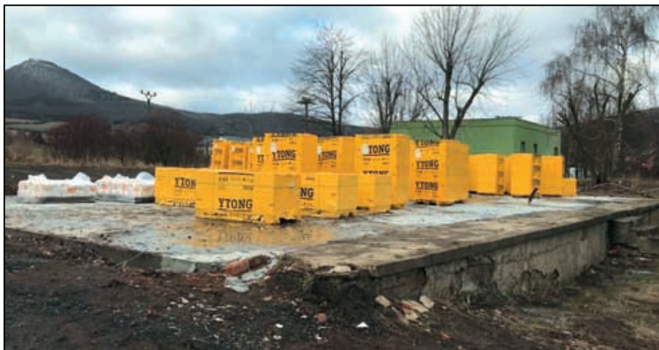
Budování školní družiny.