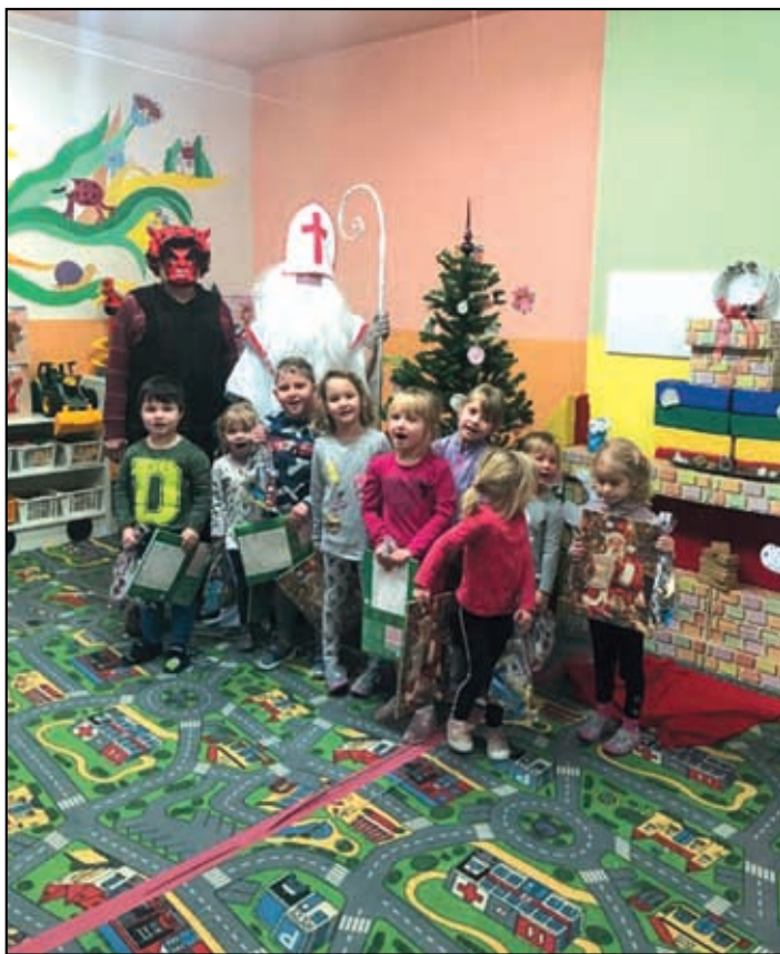
Naši obec navštívil Mikuláš s čertem.