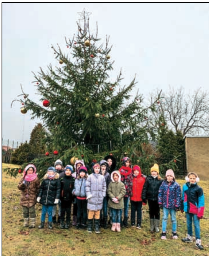
Děti u vánočního stromku ve Velemíně.