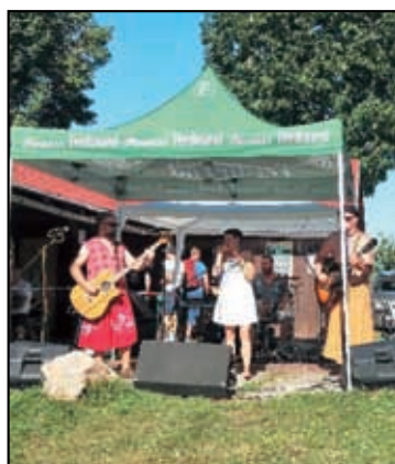
Fridrich und Fridrich.