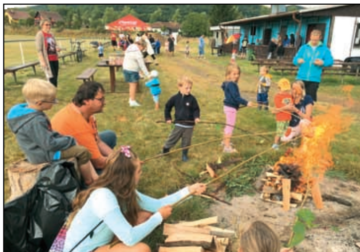
Ohlédnutí za loučením s létem 2016.

Neustále probíhá nábor nových fotbalistů. Fotbal hrají nejen chlápci, ale velice úspěšné jsou také dívky. Tréninky probíhají v zimě v místní tělocvičně. Žáci v úterý od 17.00 hodin, příprava ve čtvrtek od 16.30 hodin. Přihlásit je možné dítě od 5-ti let. Bližší informace na tel. 734 600 314. Pro kvalitnější přípravu mladých fotbalistů bychom potřebovali více dospělých, kteří jsou ochotni pomoci. Rádi přivítáme nejen případné trenéry, ale i ochotné partáky do řad asistentů trenérů.