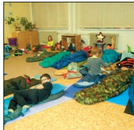
Vánoční noc ve škole