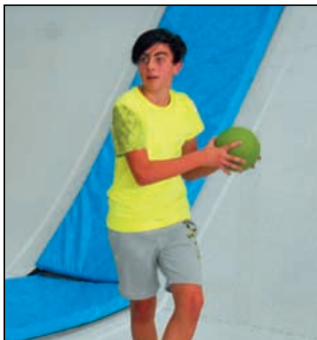
Jump park Praha

Už v září jsme s deváťáky nastoupili na cestu jejich volby povolání. V Litoměřicích byla výstava Technodays, na kterou se jeli podívat, byli také na Informačním a poradenském středisku úřadu práce, kde jim radili odborníci, jak si nejlépe zvolit školu. Pro ilustraci, jak která škola vypadá a co od ní mohou očekávat, se zúčastnili i výstavy a burzy středních škol Škola 2017. Také jsme navštívili SOŠ v Roudnici nad Labem, abychom se podívali, jak výuka a praktické vyučování vypadá přímo ve škole. Deváťáci měli také příležitost podívat se při exkurzích do velkých firem, aby měli představu, jak to ve skutečnosti je a na co se mají připravit. Exkurze byly v TRCZ a Lovochemii. Pro