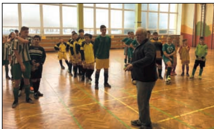
Starší dorost ASK Lovosice/SK Velemín