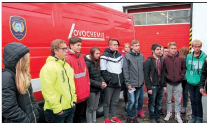
Exkurze v Lovochemii